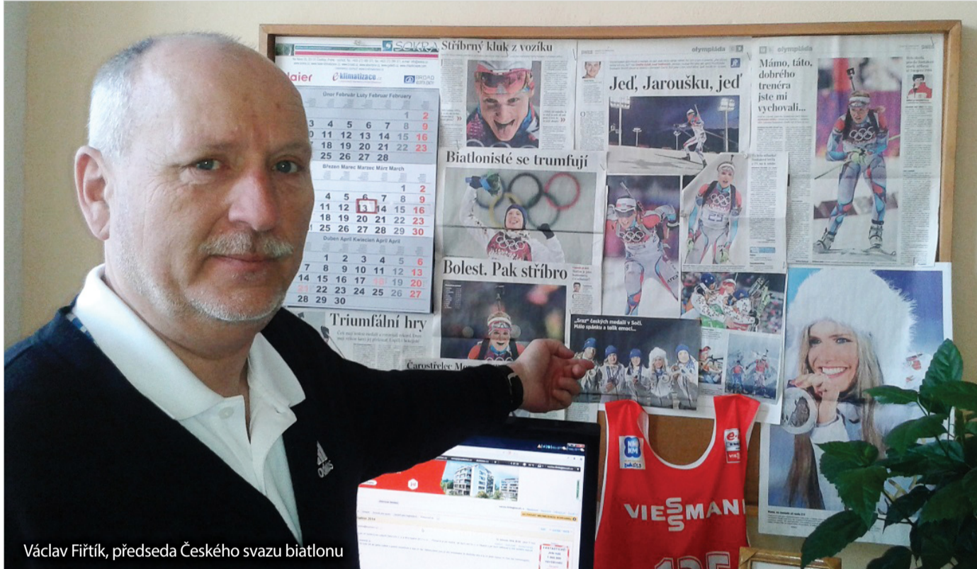
Václav Fírtík, předseda Českého svazu biatlonu