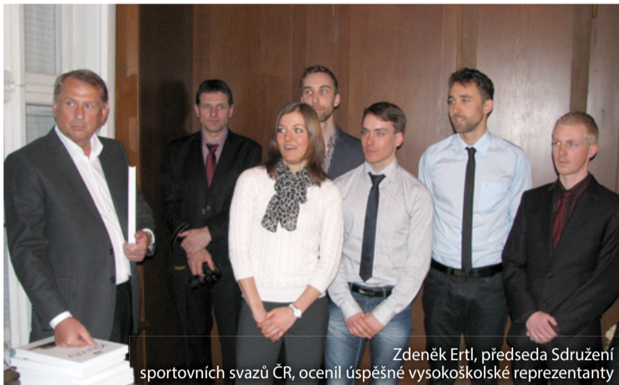
Zdeněk Ertl, předseda Sdružení sportovních svazů ČR, ocení úspěšné vysokoškolské reprezentanty

Rok 2013 nabídl českému univerzitnímu sportu hned dvě špičkové mezinárodní události – letní i zimní univerziádu. Čeští reprezentanti se těchto vrcholných akcích studentů sportovců zúčastňují a také minulý rok nebyl výjimkou. Na obou akcích hájilo barvy českého vysokoškolského sportu téměř 250 účastníků. Tradičně mezi nimi nechyběli ani zástupci České asociace akademických technických sportů (ČAATS), kteří se navíc mohou pyšnit získáním devíti medailí (dvou zlatých a sedmi bronzových).